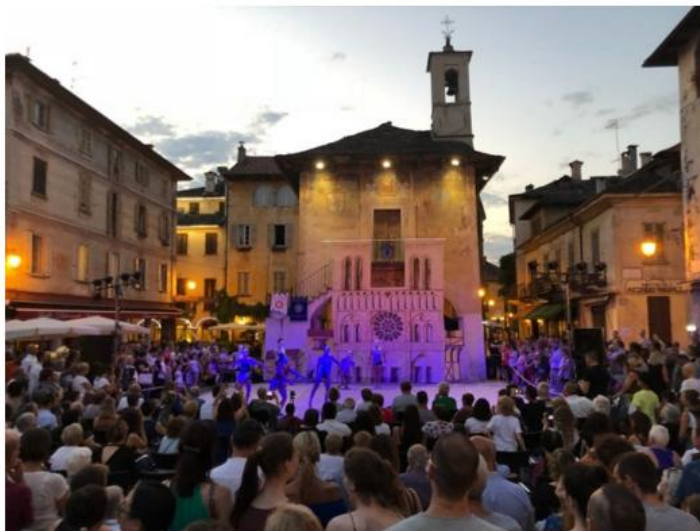
Orta, Notre Dame de Paris

Sabato 30 giugno, 85 atlete del Twirling Santa Cristina hanno "invaso" piazza Motta a Orta San Giulio, regalando uno spettacolo che ha entusiasmato. Le note di Notre Dame de Paris hanno fatto da sfondo alle evoluzioni delle ragazze.