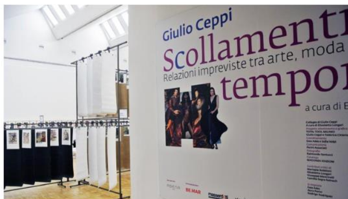
AGENA: fino all'8 luglio alla Triennale di Milano con la Mostra Scollamenti Temporalis di Giulio Ceppi.

"Scollamenti Temporalis" – visitabile fino all'8 luglio, Milano, Palazzo della Triennale.